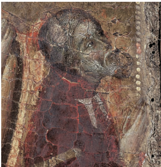
Don Juan Manuel nunca fue infante, sino hijo de infante, nieto de Fernando III, sobrino de Alfonso X y primo de Sancho IV.

Nació en Escalona el 5 de mayo de 1282; hijo del infante don Manuel, a su vez hijo de Fernando III y hermano de Alfonso X.